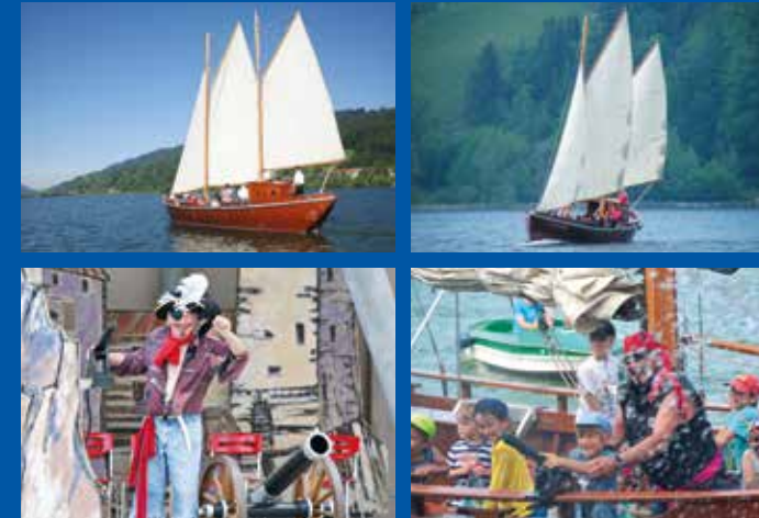
Viel Spaß haben Kinder bei einer Piratenfahrt. Buchbar in der Gästeinfo im AlpseeHaus.