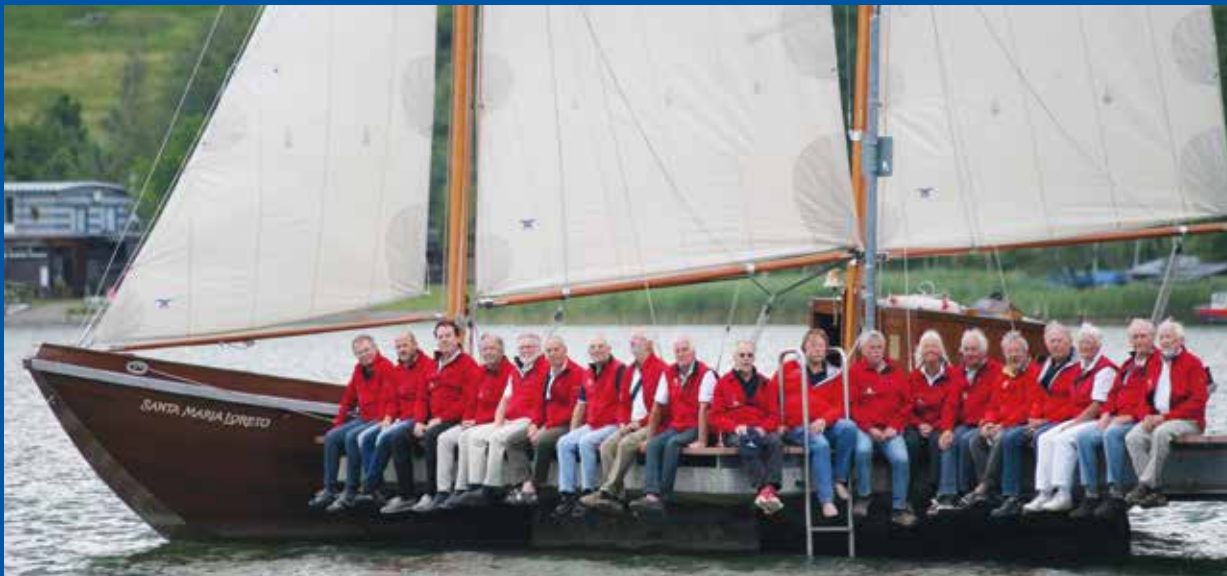
Ehrenamtliche Kapitäne sorgen für problemlosen Segelspaß auf dem Großen Alpsee!